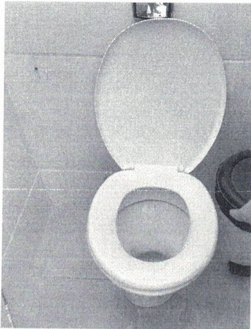
Vaso sanitário com a tampa danificada